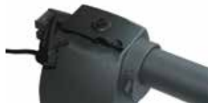
Palanca de desbloqueo manual

Sistema de desbloqueo confiable y seguro para el usuario del equipo